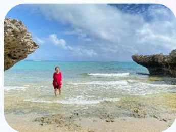
沖縄に行きました! リュックにビーチサンダル入れました! 帽子、サングラス、日焼け止め・忘れました♡ 海水は甘く美味しかった

人生うまくいくに決まっているのだー 記念日の五月一日、感謝と感動一杯で、芦屋神社参りとお墓参りをしてきました。人生何度も「生きてたあ」と安堵してきましたが、特にこの三年は想像を超えていました。三年前のマナカ開店四力月後に絶対閉めないと決めていた三宮店をフト「閉めない」と思い二週間で閉めました。その四力月後からコロナの波に襲われました。真っ暗で先が見えない中、好きな仕事に没頭しました。手探りでも動いたおかげで、経験は豊富に積むことができました。経験したおかげで心がたく強くなりました。落ち込んで、未来では笑いの種になる! 何があってもビクともしない! グッドタイミングで救いの神が現れる! 不思議なご縁でお客様や商品と出会う! 人生はうまくいくに決まっている! 二〇年ド素人がサロンをした経験談です。未熟を楽しみながら歩きましょう♪ ゆめば